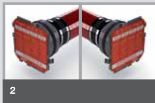
KB2 Beide Seiten mit Dichtpackung zum Einbetonieren.