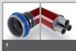
D / Dx Erste Seite zum Anschluss an eine Dichtpackung. Zweite Seite mit Systemdeckel zur Kabelabdichtung per Schrumpftechnik.