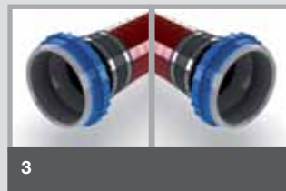
D2 Beide Seiten zum Anschluss an eine Dichtpackung.