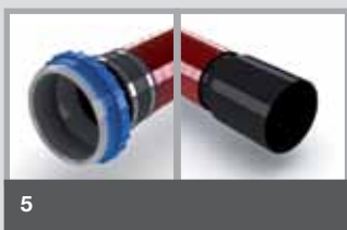
D / KM Erste Seite zum Anschluss an eine Dichtpackung. Zweite Seite mit Klebemuffe zum Anschluss eines Rohres.