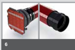
KB / SM Erste Seite mit Dichtpackung zum Einbetonieren. Zweite Seite mit Steckmuffe zum Anschluss eines glattwandigen Rohres.