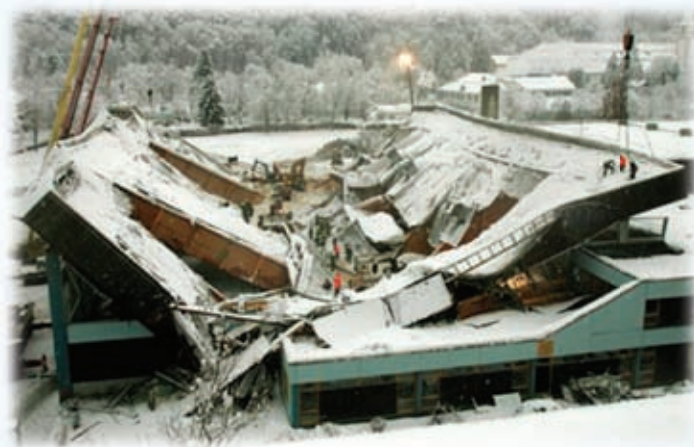
Bad Reichenhall, Nemčija, 2006

Odvodnjavanje meteornih voda na vaših strehah ter vaše odtoke in cevovode za odvodnjavanje vzamemo pod drobnogled!